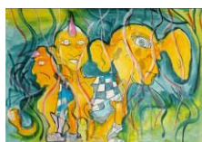
Vladimír D'Austerlitz / Miroár